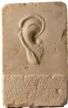
ανάγλυφο με αυτί, αφιέρωμα σε θεότητα που εισακούει τις προσευχές, 1ος αι. π.Χ. relief with ear, votive offering to a deity who listens to the prayers, 1st c. BC